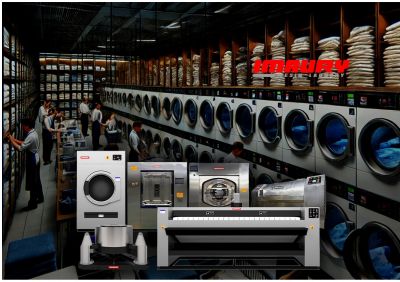
Fungsi dan Peran Departemen Laundry di Hotel: Kunci Kebersihan dan Kenyamanan Tamu